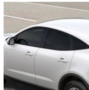
CORNICI DEI FINESTRINI