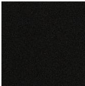
RIVESTI- MENTO DEL PADIGLIONE