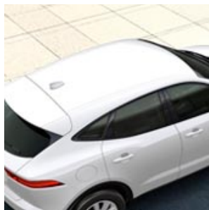
COULEUR DU TOIT