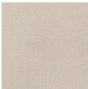
GARNITURES DE TOIT